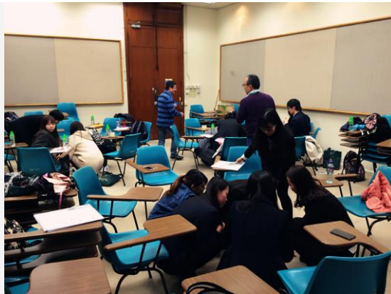
课堂上的团队合作