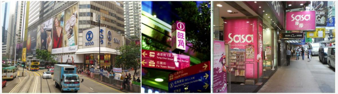
不可错过的购物狂欢