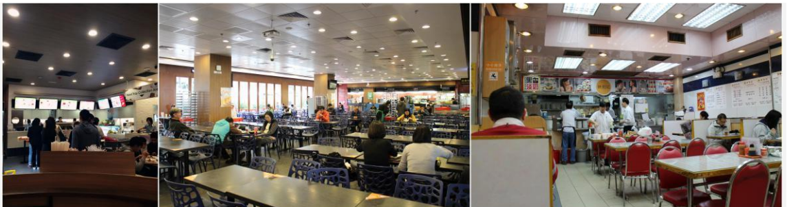
校内餐厅及港式茶餐厅