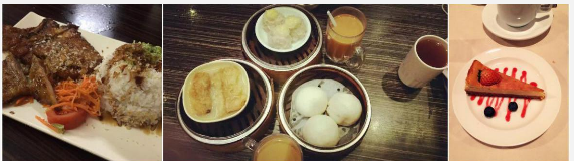
不可错过的美食诱惑